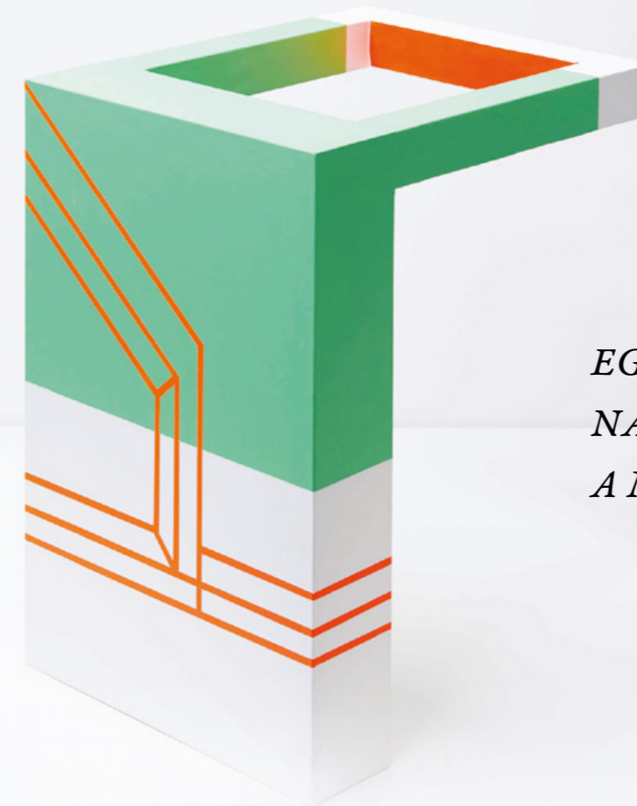
At the end of the Tunnel. Akril, vászon, fa, MDF lap, 52x15x15 cm, 2017.